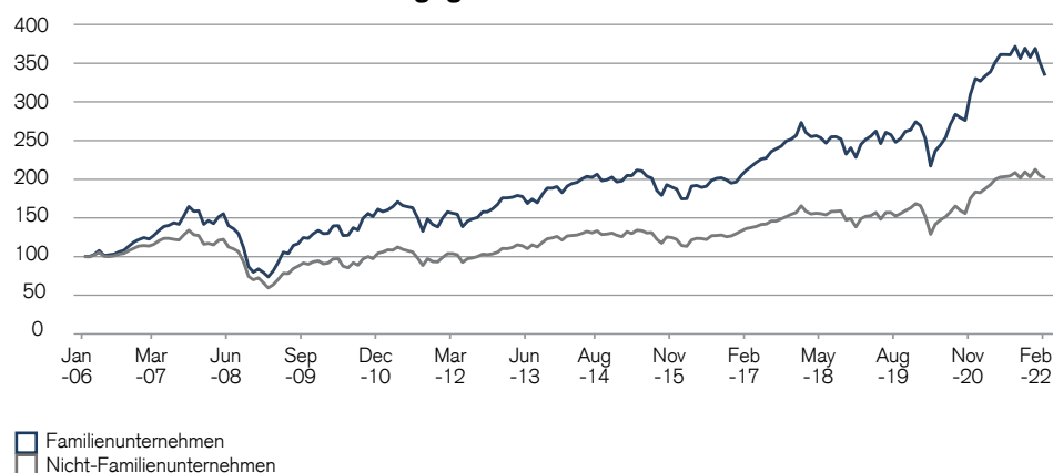
Abbildung 1: Marktkapitalisierungsgewichtete und sektorbereinigte Renditen von Unternehmen in Familienbesitz gegenüber Unternehmen in Nicht-Familienbesitz

Trotzdem lohnt es sich unserer Ansicht nach, auch in Phasen steigender Zinsen in Familienunternehmen zu investieren. Den Grund dafür sehen wir in ihrem gewichtigen, unsichtbaren Alphafaktor: Vertrauen. Durch die unternehmerische Verbundenheit sind Familienunternehmen in der Regel stärker darauf bedacht, den Interessen von Kunden, Mitarbeitern und Geschäftspartnern sowie ihrer sozialen Verantwortung gerecht zu werden. Sie tendieren auch stärker dazu, Gewinne in das Unternehmen zu reinvestieren. Dies schafft Vertrauen und ist der Schlüssel zu ihrem Erfolg. Auch, wenn kurz- oder mittelfristig die Aktien gewisser erfolgreicher Familienunternehmen eine bewertungstechnische Korrektur verkraften müssen, sollte dies das Vertrauen der Investoren in ihre langfristige Relevanz nicht tangieren. Es lohnt sich unseres Erachtens, über die lange Frist am Innovationsgeist und den Visionen von familiengeführten Unternehmen teilzuhaben und entsprechend investiert zu bleiben.